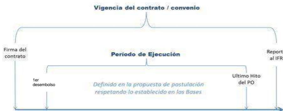
Figura 1. Vigencia y Periodo de Ejecución

Las actividades de ejecución del proyecto se inician a partir del día siguiente del primer desembolso y culminan con el fin de plazo de ejecución del proyecto.